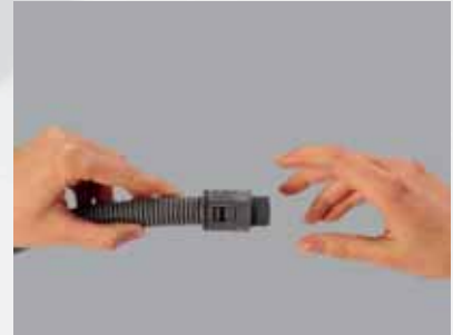
Einfach aufstecken Just press in