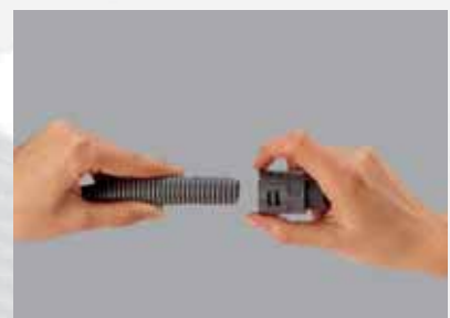
Ohne Werkzeug schnell demontiert. Bund der Rasthülse an den Grundkörper andrücken und abziehen

Quick dismantling without tools. Press ring on the housing and pull off