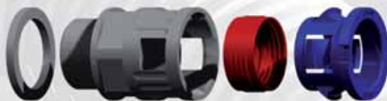
Flachdichtung flat sealing